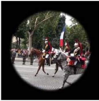
14th July 2012, 2012-2013