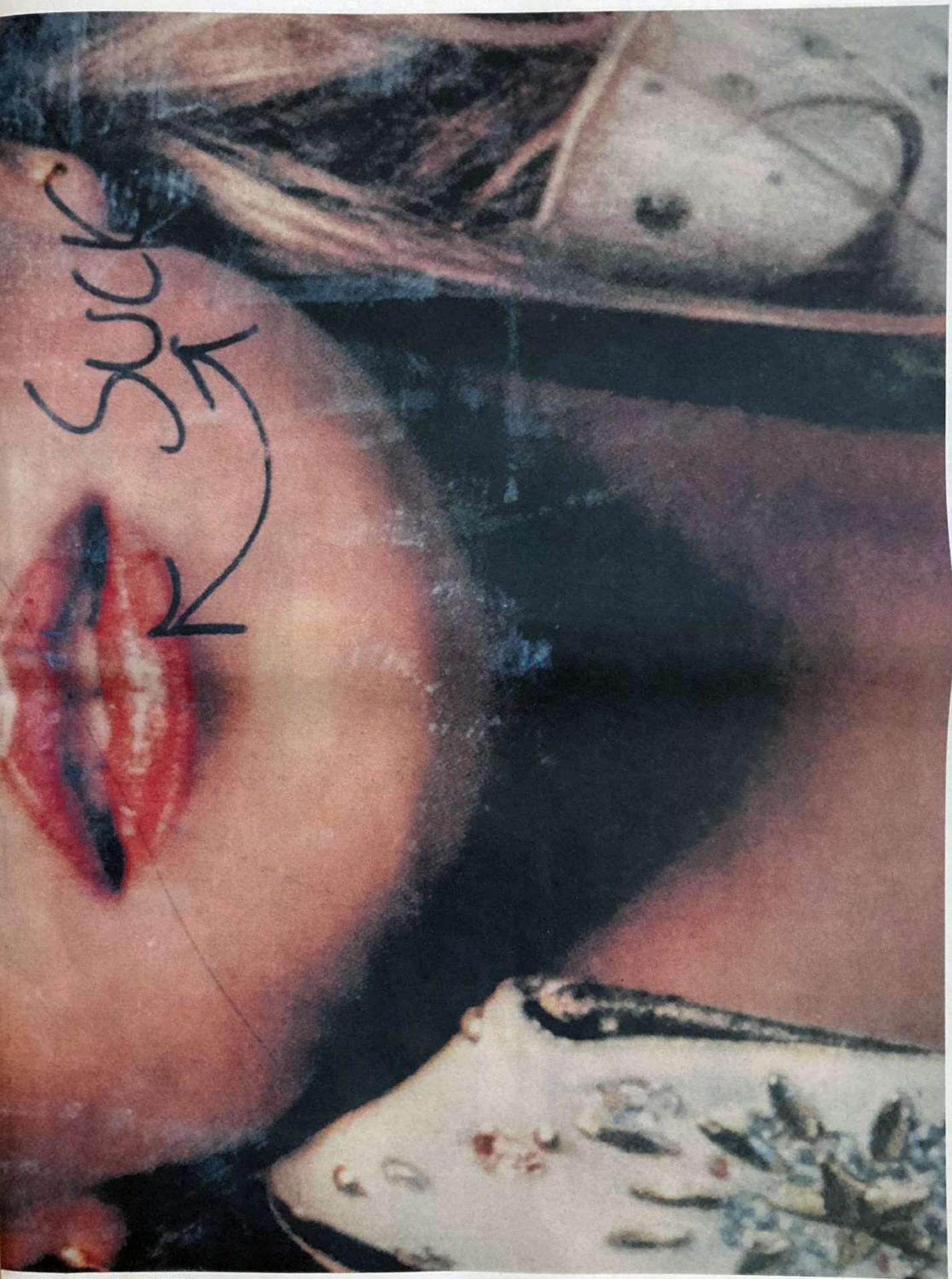
Collins, Phil: britney #2, 2001