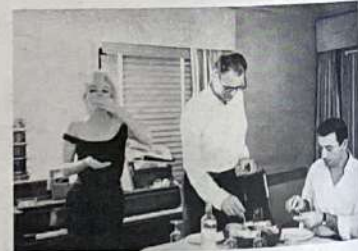
Agosti, Paola Alberto Moravia, Rom 1988 Silbergelatine-Abzug 18,7 x 27,6 cm (Blatt: 21,5 x 30,4 cm)